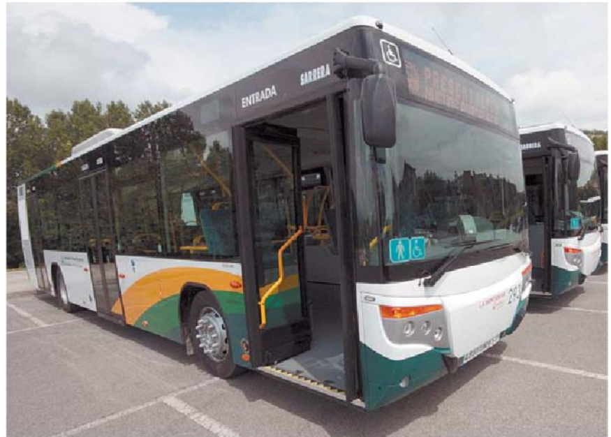
Las villavesas continúan sin frenar la pérdida de viajeros.